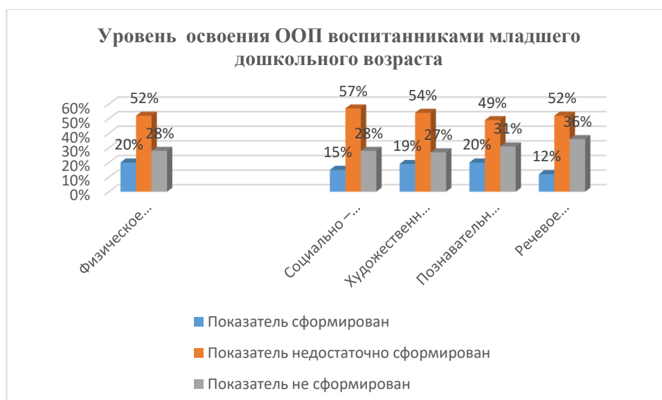
Уровень освоения ООП воспитанниками среднего дошкольного возраста, %