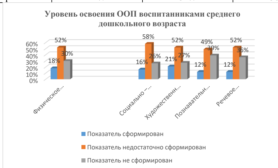
Уровень освоения ООП воспитанниками старшего дошкольного возраста, %